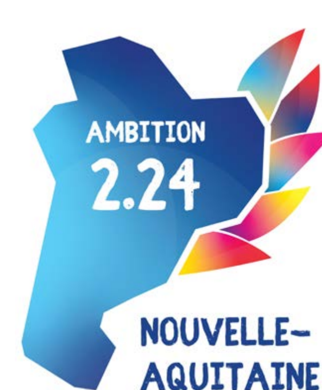
Exposition « Paris 2024 » réalisée par le Comité Régional Olympique et Sportif de Nouvelle-Aquitaine